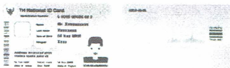
(ตัวอย่างบัตร)